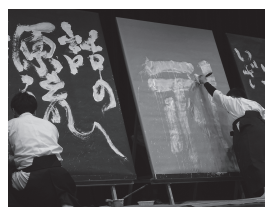
“こころ”のふれあうフェスタ2020 8.7(土) メディキット県民文化センター