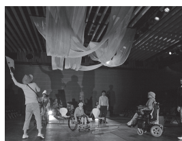
演劇公演「ゆかいアート村 はじまり物語」 7.10(土)・11(日) 三股町立文化会館

詳細やその他のイベントについては 「国文祭・芸術祭みやざき2020」 大会ホームページをご覧ください。