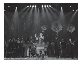
第40回わたぼうし宮崎コンサート2020 8.22(日) 宮崎市民文化ホール